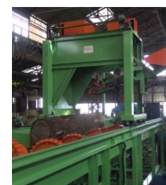
大型バーカー (樹皮むき機)